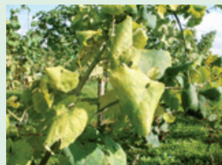
La Flavescenza dorata è soggetta a lotta obbligatoria.